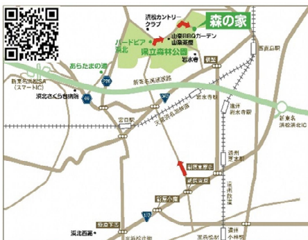
静岡県立森林公園 森の家