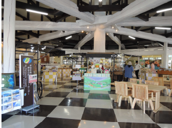
小屋組を見せた施設内

道の駅「伊豆のへそ」は平成 28 年 6 月にリニューアルし、現在の 8 角形の建物になりました。狩野川の中流域にあり、文字通り伊豆半島の中央に位置しています。内部は柱・梁・小屋組みを見せた特徴的な建物となっています。地場製品の販売のほか地ビールの販売やバウムクーヘンを施設内で作るなど来場者を楽しませています。