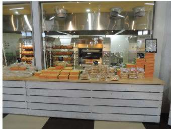
バウムクーヘン工場