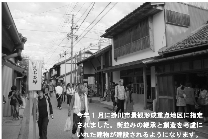
今年1月に掛川市景観形成重点地区に指定されました。街並みの継承と創造を考慮にいたれた建物が建設されるようになります。