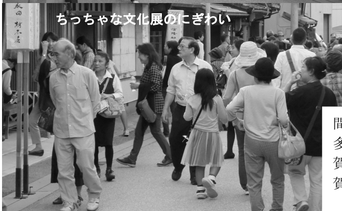
ちっちゃな文化展のにぎわい