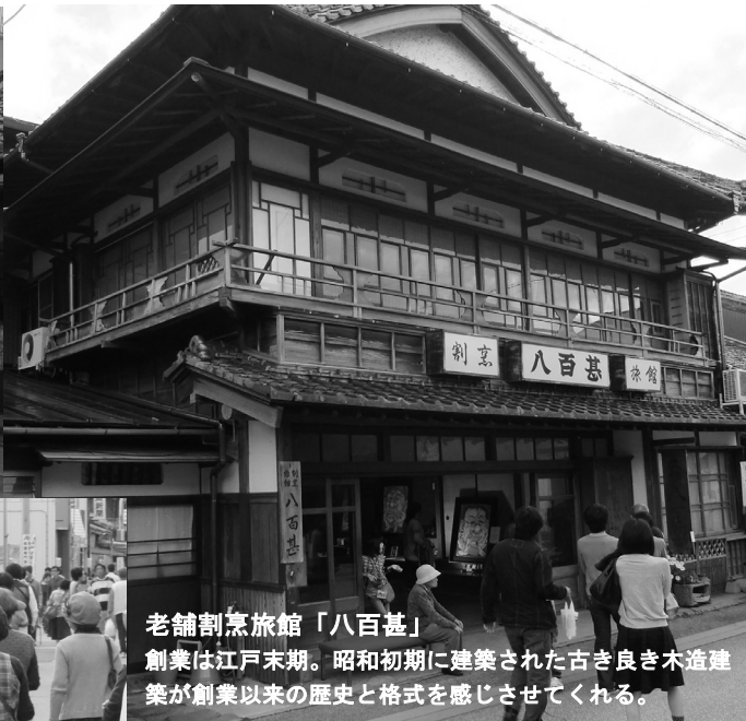
老舗割烹旅館「八百甚」 創業は江戸末期。昭和初期に建築された古き良き木造建築が創業以来の歴史と格式を感じさせてくれる。