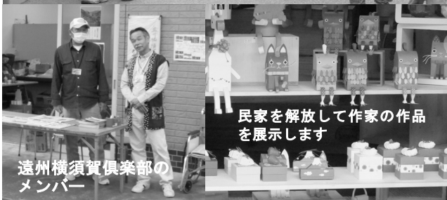
民家を解放して作家の作品を展示します