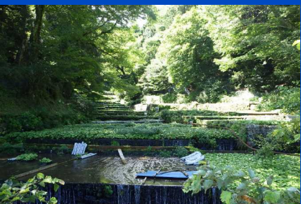
第11回 地域で継承！ 八岳地区の「わさびの郷」づくり (伊豆市)