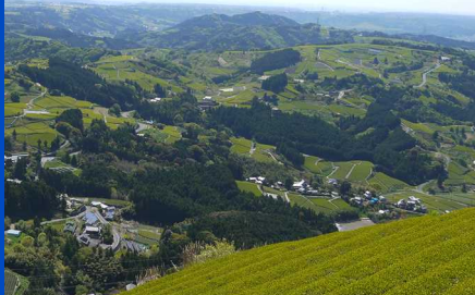
第13回 伝統農法が織りなす 茶草場テラスから望む東山大茶園 (掛川市)