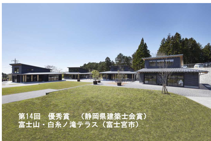
第14回 優秀賞（静岡県建築士会賞） 富士山・白糸ノ滝テラス（富士宮市）