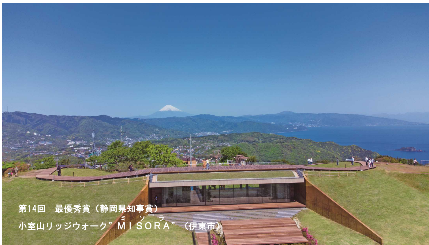
第14回 最優秀賞（静岡県知事賞） 小室山リッジウォーク”MISORA”（伊東市）