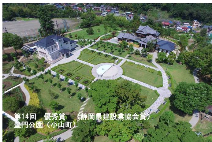
第14回 優秀賞（静岡県建設業協会賞） 豊門公園（小山町）