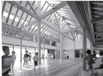
燃え代設計の保育所 (設計: 古川泰司)