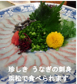
珍しき うなぎの刺身 浜松で食べられます