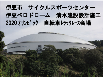
伊豆市 サイクルスポーツセンター 伊豆ベロドローム 清水建設設計施工 2020 年リビッパ 自転車トラックレース会場