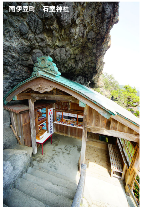
南伊豆町 石室神社