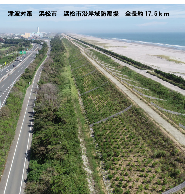
津波対策 浜松市 浜松市沿岸域防潮堤 全長約 17.5 km