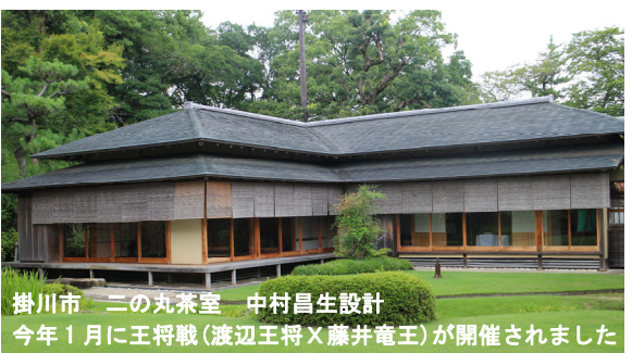
掛川市 二の丸茶室 中村昌生設計 今年1月に王将戦(渡辺王将×藤井竜王)が開催されました