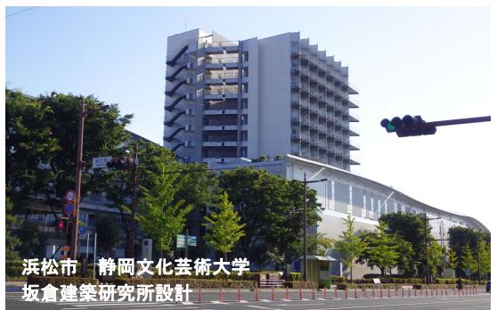
浜松市 静岡文化芸術大学 坂倉建築研究所設計