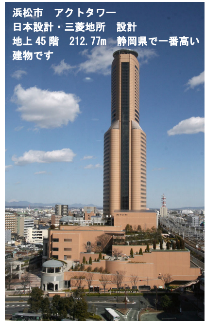
浜松市 アクトタワー 日本設計・三菱地所 設計 地上 45 階 212.77m 静岡県で一番高い 建物です