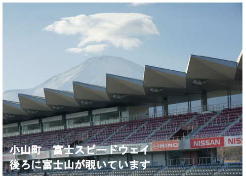
小山町 富士スピードウェイ 後ろに富士山が覗いています