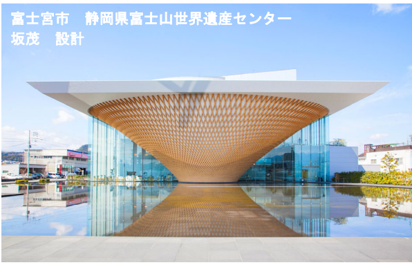
富士宮市 静岡県富士山世界遺産センター 坂茂 設計