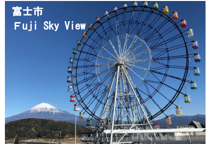
富士市 Fuji Sky View