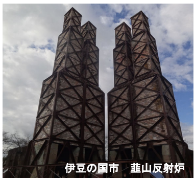
伊豆の国市 富士山反射炉