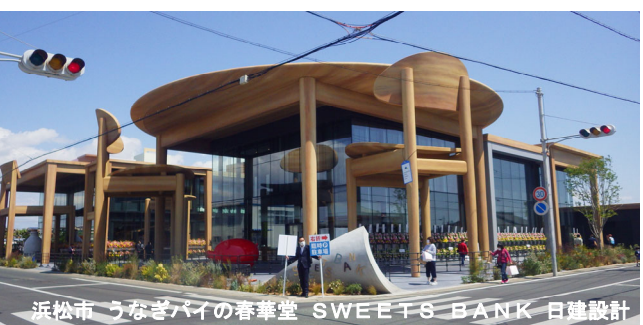
浜松市 うなぎパイの春華堂 SWEETS BANK 日建設計