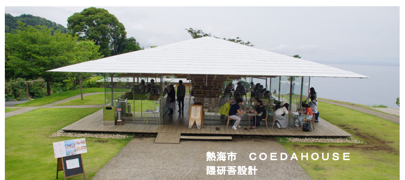
熱海市 COEDAHOUSE 隈研吾設計