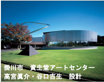
掛川市 資生堂アートセンター 高宮真介・谷口吉生 設計