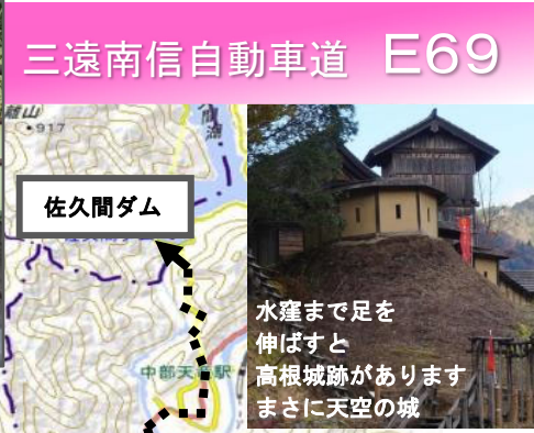
水達まで足を伸ばすと高根城跡がありますまさに天空の城