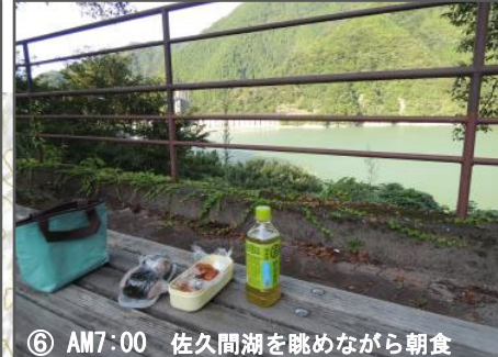
⑥ AM7:00 佐久間湖を眺めながら朝食