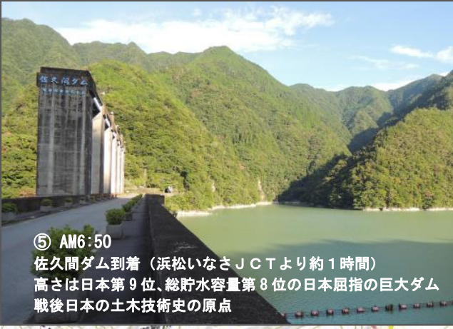
⑤ AM6:50 佐久間ダム到着 (浜松いなさJCTより約1時間) 高さは日本第9位、総貯水容量第8位の日本屈指の巨大ダム 戦後日本の土木技術史の原点