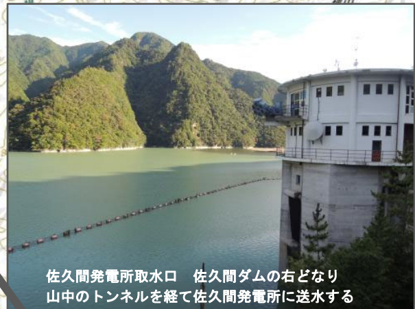
佐久間発電所取水口 佐久間ダムの右どなり山中のトンネルを経て佐久間発電所に送水する