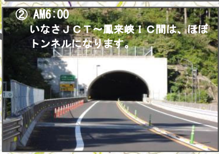
② AM6:00 いなさJCT～鳳来峡IC間は、ほぼトンネルになります。