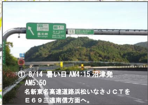
① 8/14 暑い日 AM4:15 沼津発 AM5:50 名新東名高速道路浜松いなさJCTをE69三遠南信方面へ。

三遠南信自動車道は静岡県浜松市北区の新東名高速道路・浜松いなさJCTから愛知県を経由して長野県飯田市の中央自動車道・飯田山本ICに至る、約100kmの高規格幹線道路で高速道路ナンバリングは「E69」(国道474号の自動車専用道路に指定されている)。 三遠南信とは愛知県東部(旧三河国)、静岡県西部(旧遠江国)、長野県南部(南信地方)の総称。 現在、①浜松いなさJCT～鳳来峡IC ②東栄IC～佐久間川合IC 長野側は、③飯田山本IC～天龍峡IC～飯田上久堅・喬木富田IC ④喬木IC～程野IC(仮出入口) 4区間が不連続で開通している。 いまのところ全線無料。