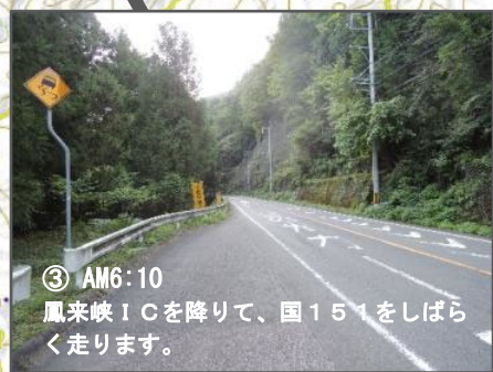
③ AM6:10 鳳来峡ICを降りて、国151をしばらく走ります。