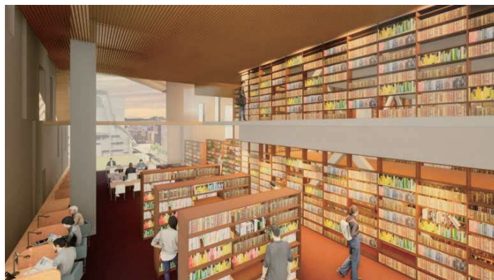
高層階の調査研究に没頭できる静かな空間 (7階閲覧室イメージ)