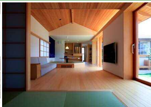
最優秀賞：悠結のイエ