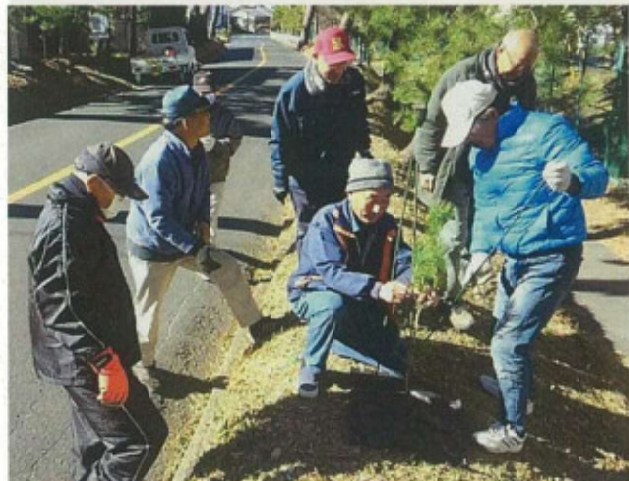
第12回 最優秀賞（県知事賞） 久努の松並木（袋井市）