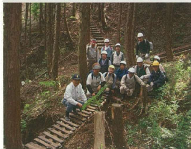
第12回 優秀賞 大丸山における森づくり（伊東市）