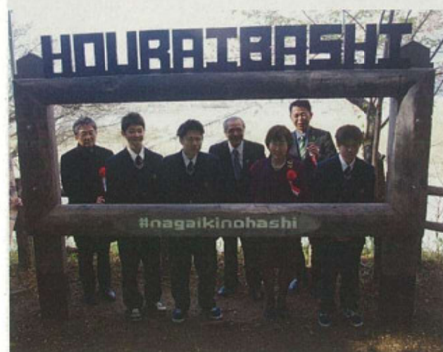
第12回 奨励賞 蓮葉橋を望む木製フォトフレーム（島田市）