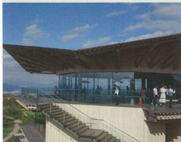
第12回 優秀賞 日本平夢テラス（静岡市清水区）