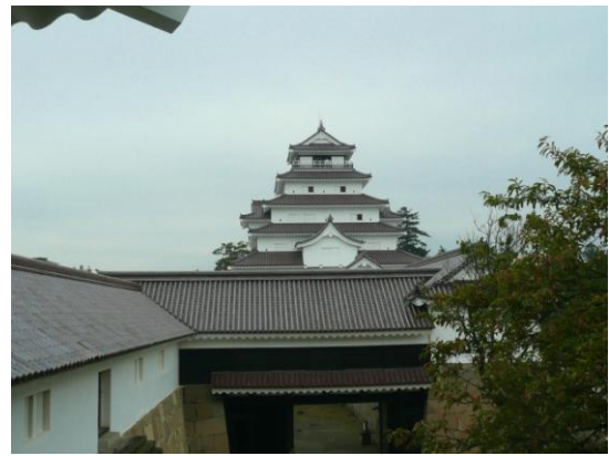
委員賞 「秋の鶴ヶ城 2」 会津若松 三島地区 西山洋雄