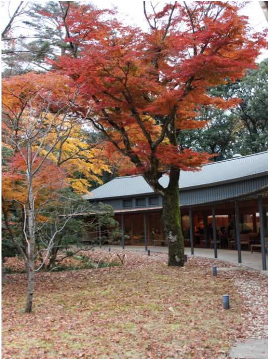
優秀賞 「晩秋のとらや工房」 裾野地区 萩原克哉