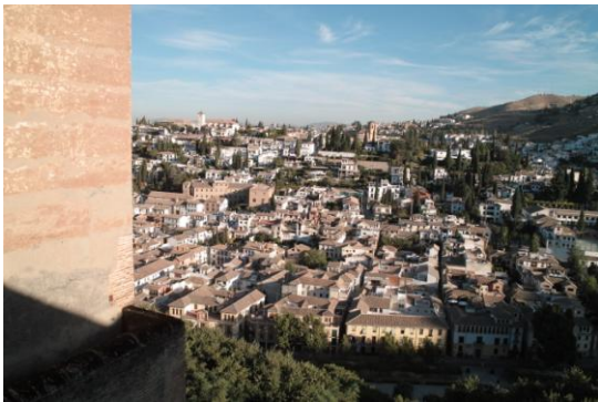
「アルハンブラ宮殿よりグラナダの街並み (スペイン)」 富士地区 斉藤邦男