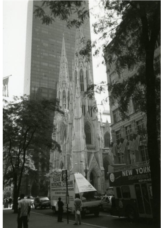
委員賞 「ニューヨーク 休日のセント・パ トリック教会」 沼津地区 塩見敏弘