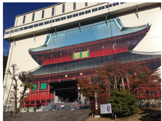
「日光輪王寺三仏堂仮設」 三島地区 森勲