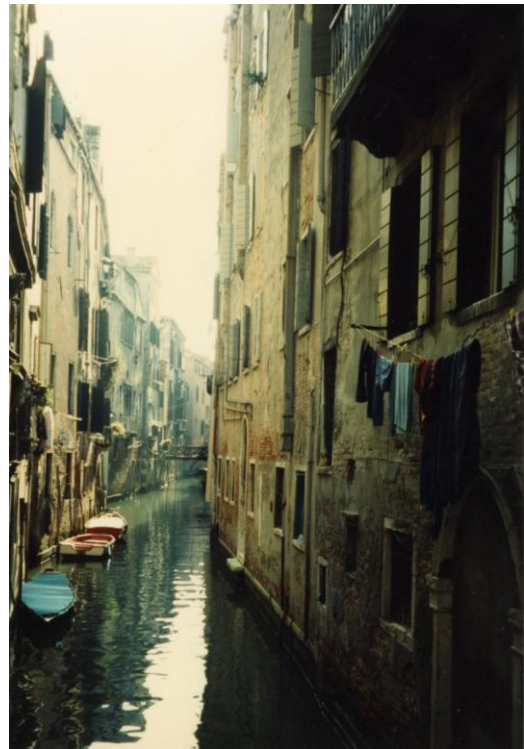
特別賞 「ベネチアの路地裏運河」 沼津地区 塩見敏弘