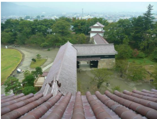
委員賞 「秋の鶴ヶ城 3 会津若松」 三島地区 西山洋雄