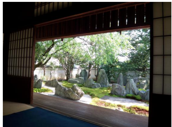
委員賞 「重森三玲 庭園美術館 2」 三島地区 西山洋雄