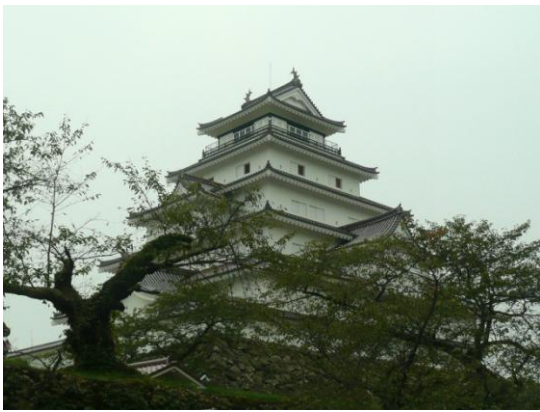
委員賞 「秋の鶴ヶ城 1」 会津若松 三島地区 西山洋雄