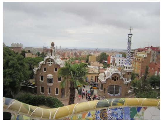
「ガウディーのグエル公園と未来住宅 (スペイン)」 富士地区 斉藤邦男