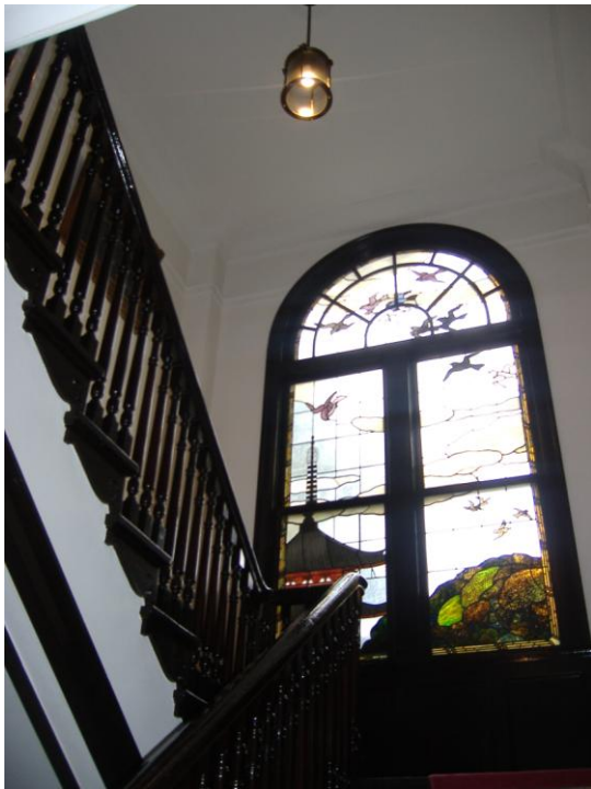
「鳩山会館ステンドグラス」 沼津地区 塩見敏弘