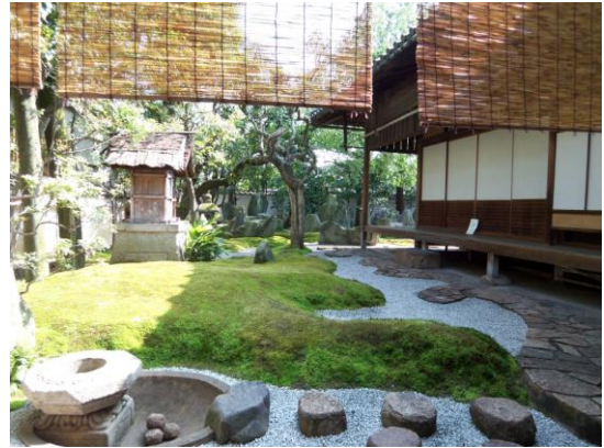
特別賞 「重森三玲 庭園美術館 1」 三島地区 西山洋雄