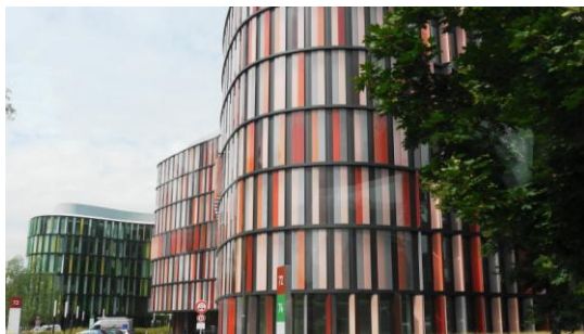
「ドイツ ケルン市内カラフル建物」 三島地区 森勲