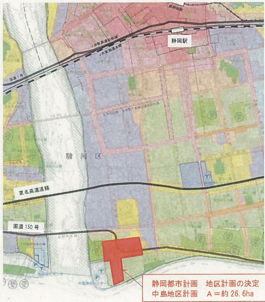
(凡例) 地区計画決定区域